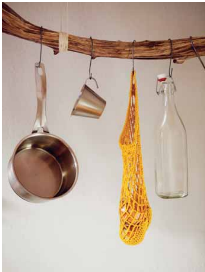
Vaahterat muuttivat yksiön niin läheltä, että muuttokuorma hoidettiin lastenrattailla.

S uomalaisilla on keskimäärin 39 neliötä asuinpinta-alaa henkeä kohti. Se on 20 neliötä enemmän kuin 40 vuotta sitten.